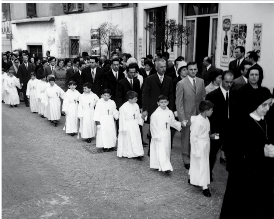
1969, Prime Comunioni.

In copertina: 9 giugno, Messa domenicale in Oratorio nell'ultimo giorno della "Festa dell'Oratorio".